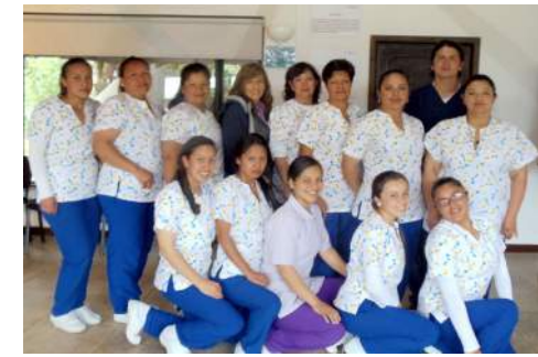
Equipo de Auxiliares Calucé que pronto recibirá la certificación de la profundización en el SENA.

Resaltamos la entrega, la disposición y la responsabilidad de cada uno de los servidores asistentes quienes estudiaron con juicio las 240 horas del curso. El primer grupo contó con la participación de 14 auxiliares de Calucé, también cuatro auxiliares del