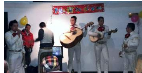
¡Feliz cumpleaños! Que sean muchos más llenos de bendiciones.

Un momento para reunirnos y compartir una sonrisa y la alegría de la vida. ■