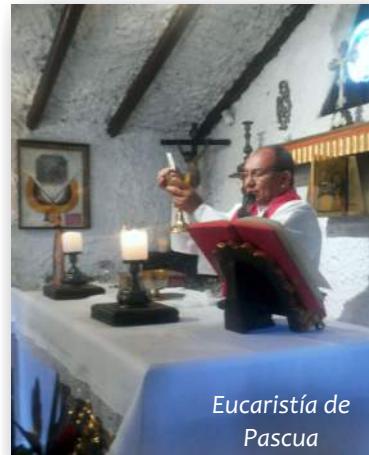
Eucaristía de Pascua

Que el mes de mayo que se aproxima esté lleno de hermosos momentos y nos permita estar rodeados de las cosas bonitas de la existencia. Un mes para homenajear a las madres, abuelas y mujeres que dieron un sí a la vida. ■