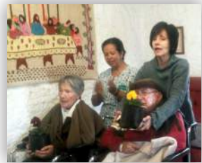
Con bellas flores se celebró un Domingo de ramos muy especial en la familia Calucé

Semana Santa nos dio la oportunidad de reflexionar en torno a no ser indiferentes al otro, a sus alegrías y también a sus sufrimientos, por ello en Calucé tuvimos la oportunidad de vivir cada celebración de estos días en paz y tranquilidad, con el respeto de los diferentes