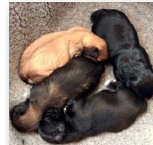
El milagro de la vida

La interacción huéspedes –mascotas– es increíble. Cumplen su misión en la vida cuidando y atendiendo, no solo a su propietario (aunque yo dudo quien es el propietario), sino a todos aquellos que necesitan, en momentos de angustia, los amorosos mimos de un amigo, que sabe escuchar, y no nos cuestiona. ■